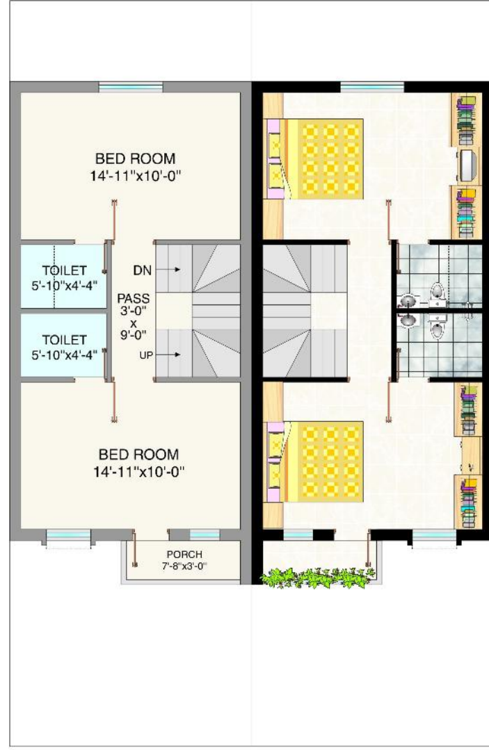
FIRST FLOOR PLAN